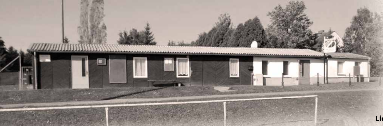
Das Vereinsheim (Baracke), Baujahr ca. 1978 darin untergebracht: