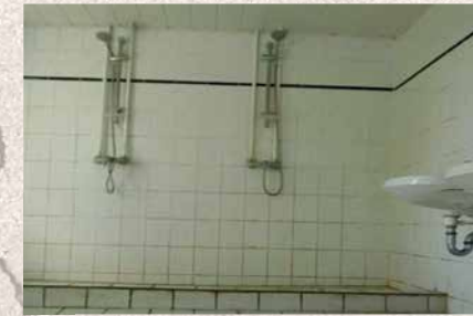
Unhaltbare Zustände auch hier: